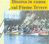
Discesa in canoa sul Fiume Tevere