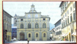
Palazzo del Podestà